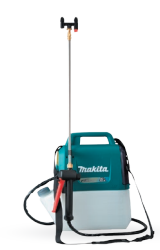
DUS054 Pulverizadora de 5L 18V