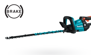
DUH601 Cortasetos de 23-5/8" 18V