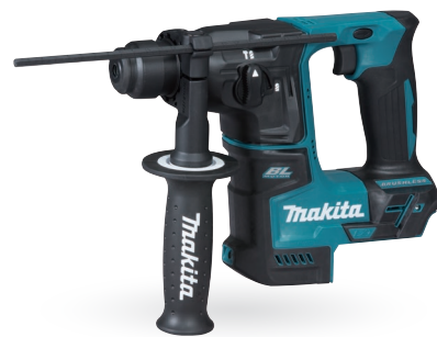
DHR171 Rotomartillo SDS-PLUS 11/16" 18V