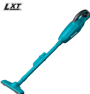
DCL180 Aspiradora de bastón 18V