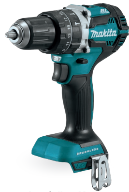
DHP484 Taladro percutor de 1/2" 18V