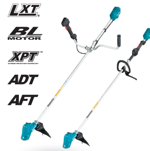
DUR190U / DUR190L Desbrozadora de 300mm 18V