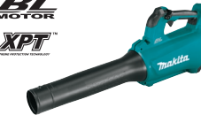
DUB184 Sopladora 18V