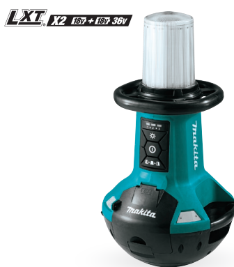
DML810 Luz de trabajo 18V