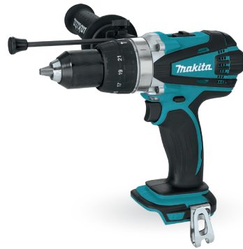
DHP458 Taladro percutor de 1/2" 18V