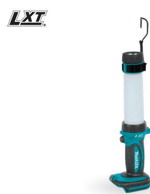
DML806 Linterna 18V