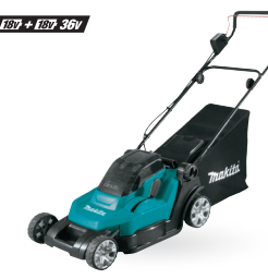
DLM432 Cortacésped de 17" 18Vx2