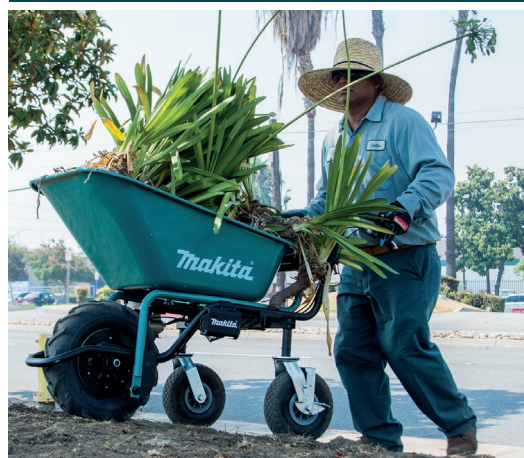
DCU180 Carretilla con potencia asistida 18Vx2