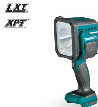
DML812 Linterna/Reflector 18V