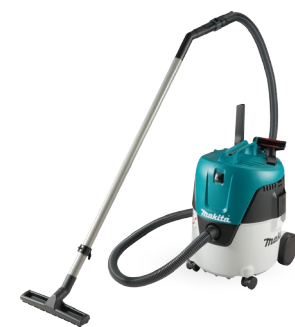
VC2000L Aspiradora eléctrica