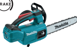
DUC254 Motosierra de 10" 18V