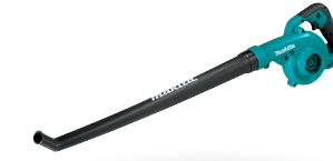
DUB186 Sopladora / Aspiradora 18V