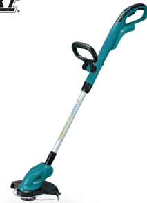
DUR181 Desbrozadora de 260mm 18V