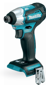
DTD157 Atornillador de impacto de 1/4" 18V