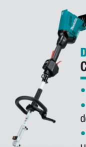
DUX60 Cabezal multifunción 18Vx2