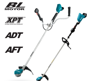
DUR368A / DUR368L Desbrozadora de 350 mm 18Vx2