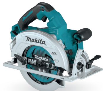
DHS780 Sierra circular de 7-1/4" 18Vx2