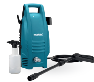
HW101 Hidrolavadora eléctrica