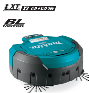
DRC200 Aspiradora robótica 18Vx2