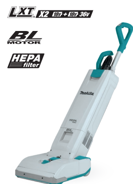
DVC560 Aspiradora vertical 18Vx2