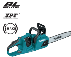
DUC355 Motosierra de 14" 18Vx2