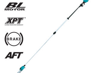
DUA301 Motosierra de altura de 12" 18Vx2