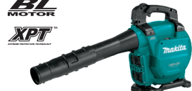
DUB363 Sopladora / Aspiradora 18Vx2