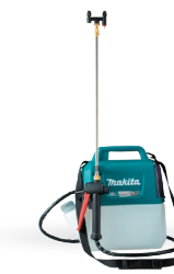
US053 Pulverizadora de 5L 12V