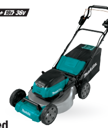
DLM532 Cortacésped Autopropulsado de 21" 18Vx2