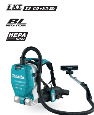
DVC261 Aspiradora de mochila 18Vx2