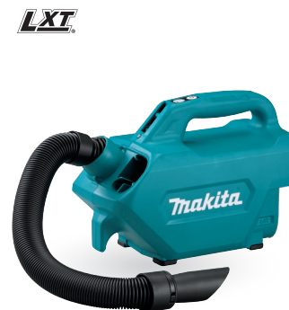
DCL184 Aspiradora 18V