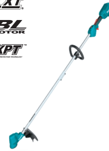
DUR192L Desbrozadora de 300mm 18V