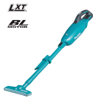
DCL281 Aspiradora de bastón 18V