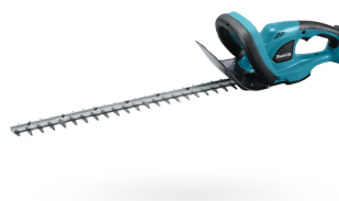
DUH523 Cortasetos de 20-1/2" 18V