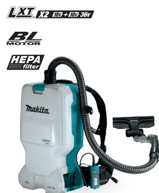
DVC660 Aspiradora de mochila 18Vx2