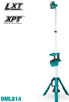
DML814 Luz de trabajo 18V